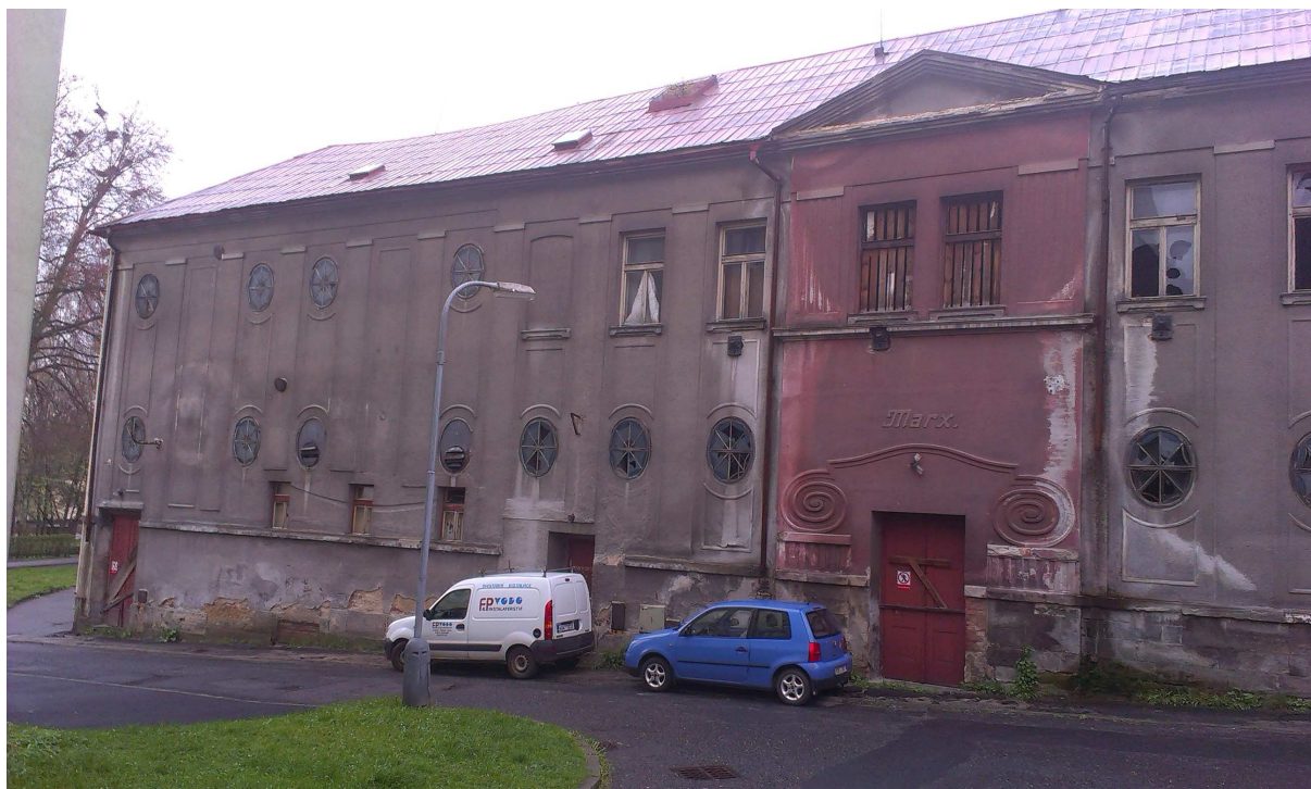
Obr.č.1. Jihovýchodní část objektu