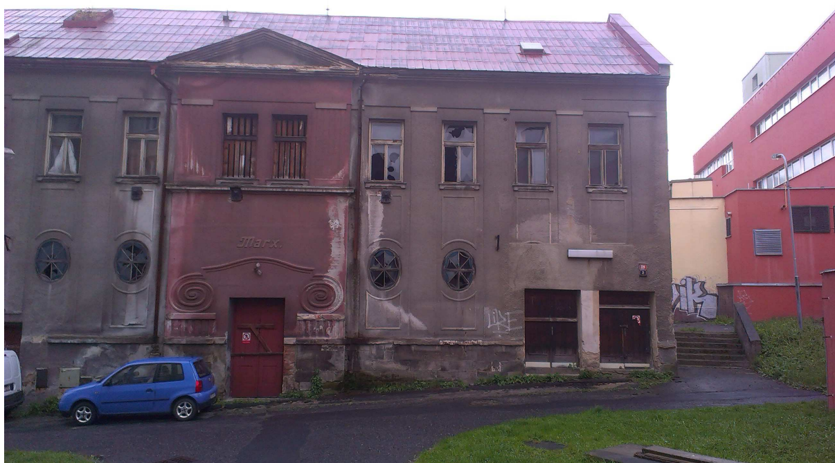
Obr.č.2. – Jihovýchodní část objektu