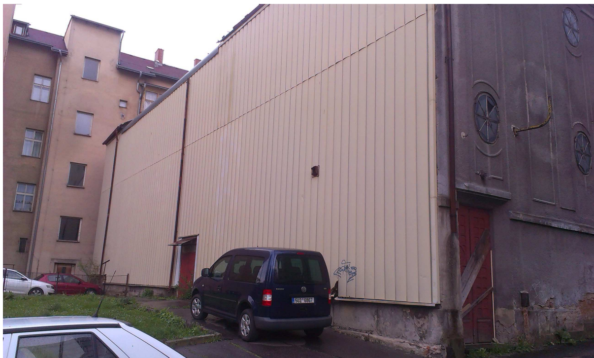
Obr.3. – Jihozápadní část objektu