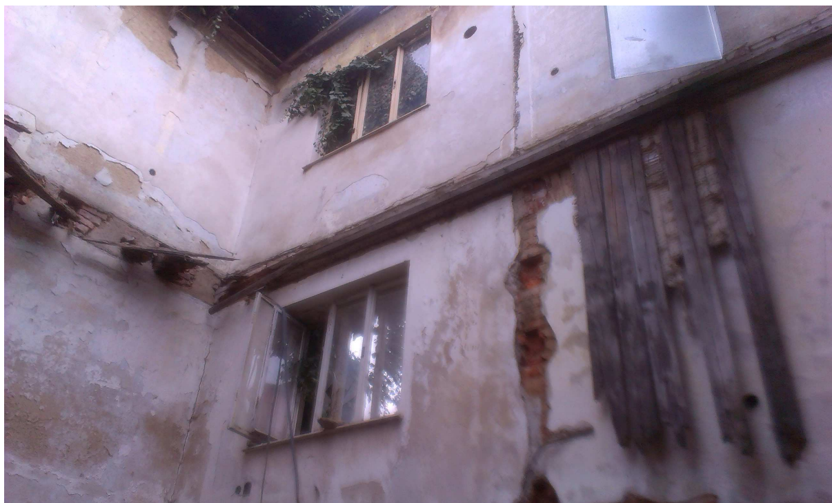
Obr.č.11 – Přístavek –zborcená stropní konstrukce