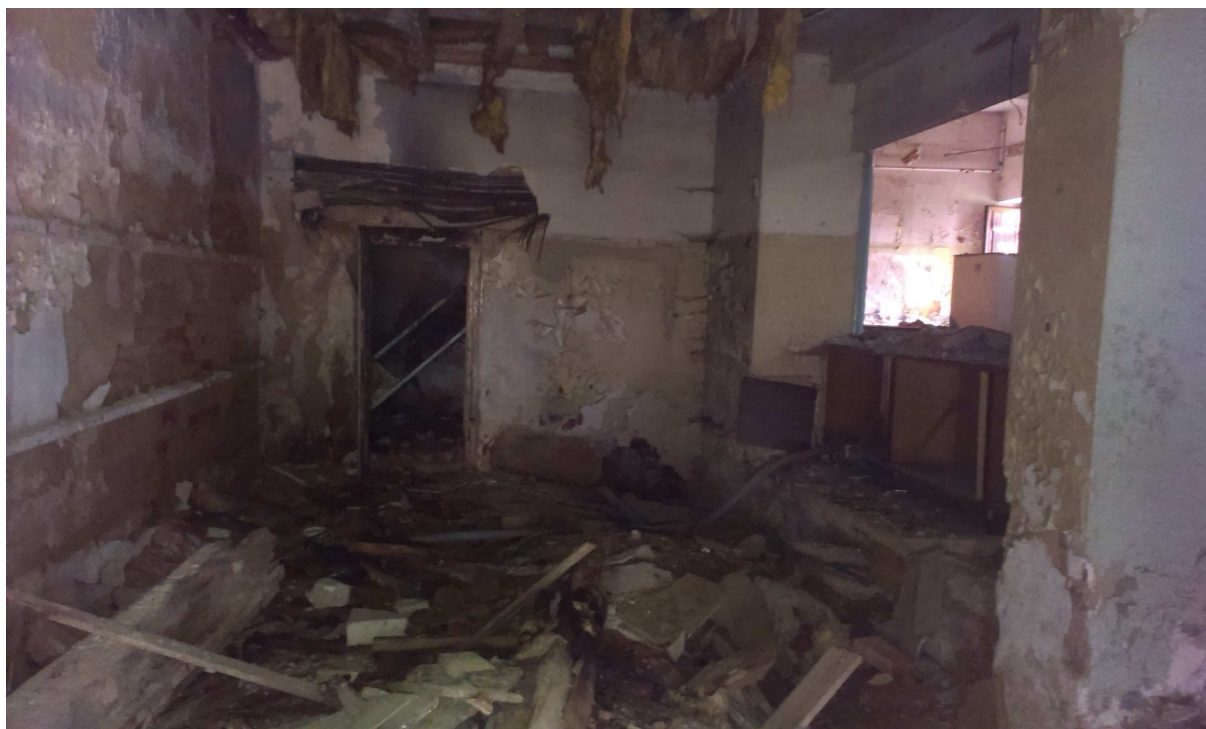
Obr.č.9 – Prostor bývalé šatny kina