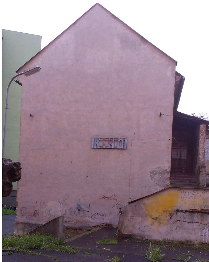
Obr.č.5 – Severní část objektu