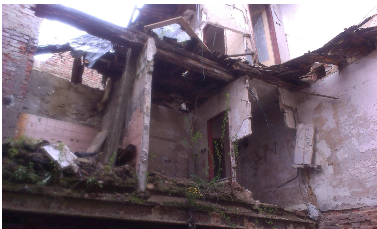
Obr.č. 10 – Severní strana objektu - přístavek