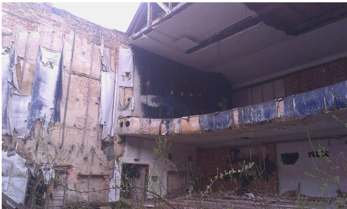
Obr.č.7 – Prostor hlediště, balkon – zřícená část střešní konstrukce