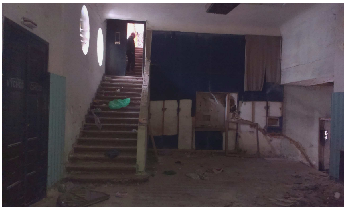
Obr.č.8 – Vestibul, schodiště na balkon