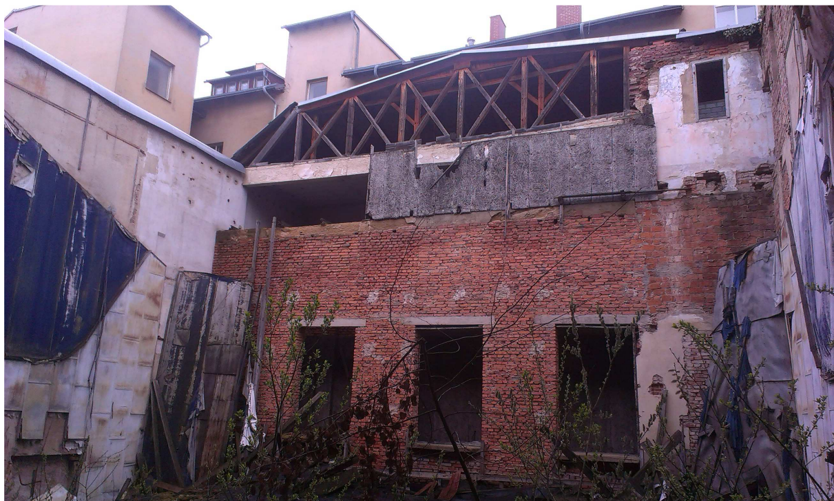
Obr.č.6. – Prostor hlediště – zřícená část střešní konstrukce