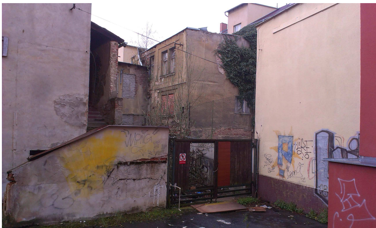
Obr.č. 4. – Severní část objektu