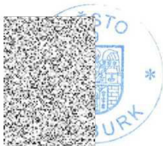
Jiří Pimpara Objednatel